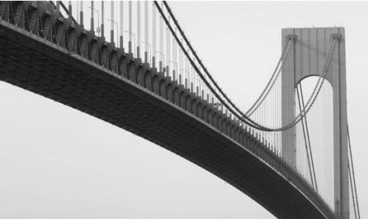
Podpis obrazu: Podpis obrazu: aby Twój dokument uzyskał profesjonalny wygląd, program Word zawiera projekty nagłówków, stopek, stron tytułowych i pól tekstowych, które uzupełniają się nawzajem.

Motywy i style ułatwiają także zachowanie koordynacji dokumentu. Po kliknięciu przycisku Projektowanie i wybraniu nowego motywu obrazu, wykresy i grafika SmartArt zmieniają się w celu dopasowania do nowego motywu. Po zastosowaniu stylów nagłówki zmieniają się w celu ich dopasowania do nowego motywu.