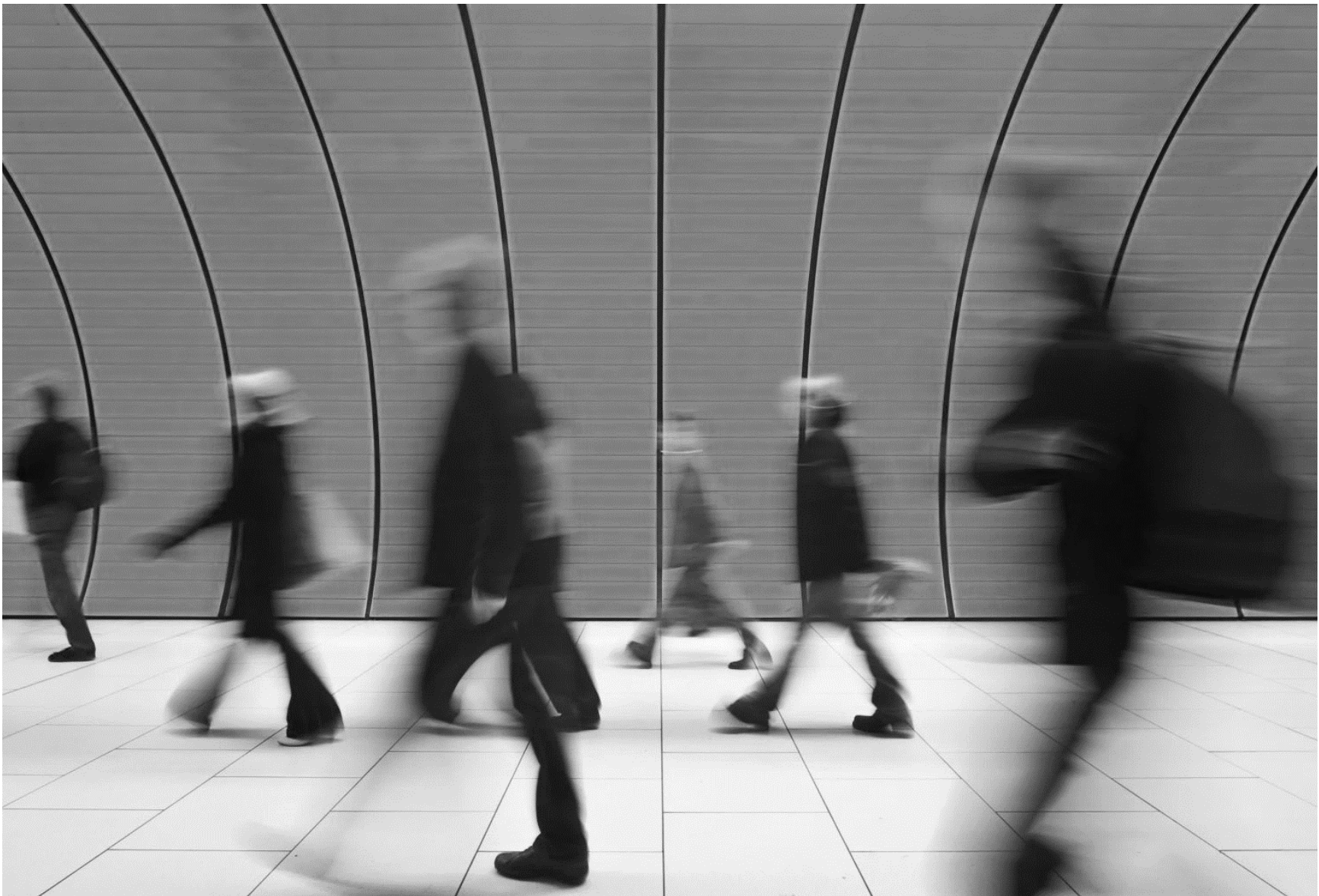
Podpis obrazu: aby Twój dokument uzyskał profesjonalny wygląd, program Word zawiera projekty nagłówków, stopek, stron tytułowych i pól tekstowych, które uzupełniają się nawzajem.