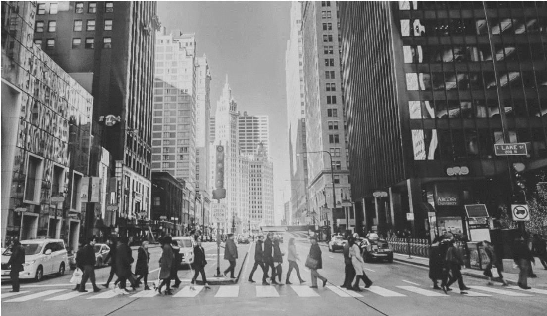
Podpis obrazu: aby Twój dokument uzyskał profesjonalny wygląd, program Word zawiera projekty nagłówków, stopek, stron tytułowych i pól tekstowych, które uzupełniają się nawzajem.