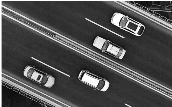
Podpis obrazu: aby Twój dokument uzyskał profesjonalny wygląd, program Word zawiera projekty nagłówków, stopek, stron tytułowych i pól tekstowych, które uzupełniają się nawzajem.

Gdy pracujesz nad tabelą, kliknij miejsce, gdzie chcesz dodać wiersz lub kolumnę, a następnie kliknij znak plus (+).